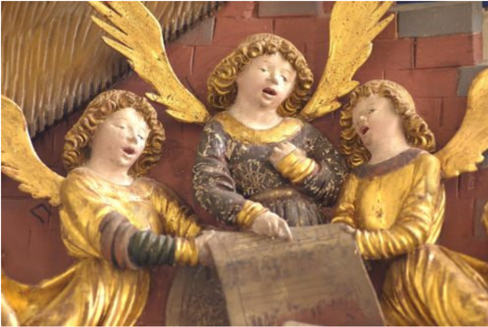
„Singende Engel“, Ausschnitt aus dem Flügelaltar in der Wallfahrtskirche St. Wolfgang ob Grades, 1515

Engel auf den Feldern singen, stimmen an ein himmlisch Lied, und im Widerhall erklingen auch die Berge jauchzend mit. |: Gloria in excelsis deo :|