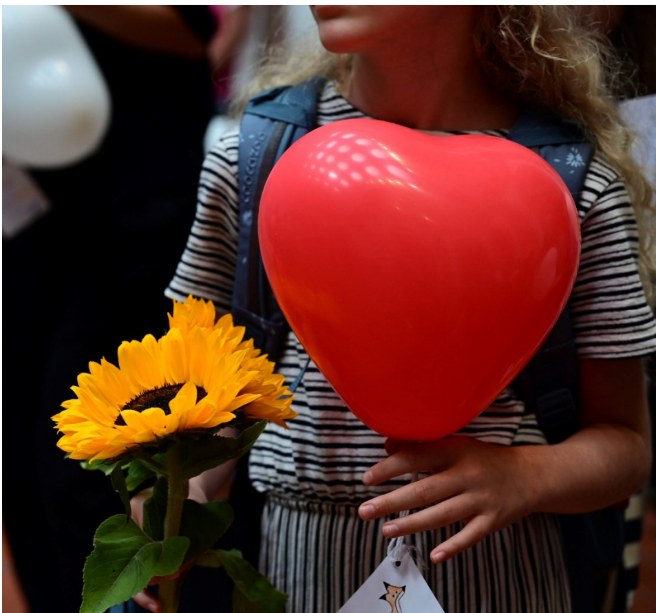
Einschulung der 5. Klassen

Sehr geehrte Damen und Herren, liebe Eltern, liebe Schülerinnen und Schüler, herzlich grüße ich Sie aus dem AMG. Ich hoffe, Sie hatten schöne und erholsame Ferien und sind in guter Stimmung ins neue Schuljahr gestartet. Zu dessen Beginn möchte ich Sie auf diesem Wege über den Schulstart informieren und Ihnen wieder einige Neuigkeiten aus unserem Haus mitteilen.