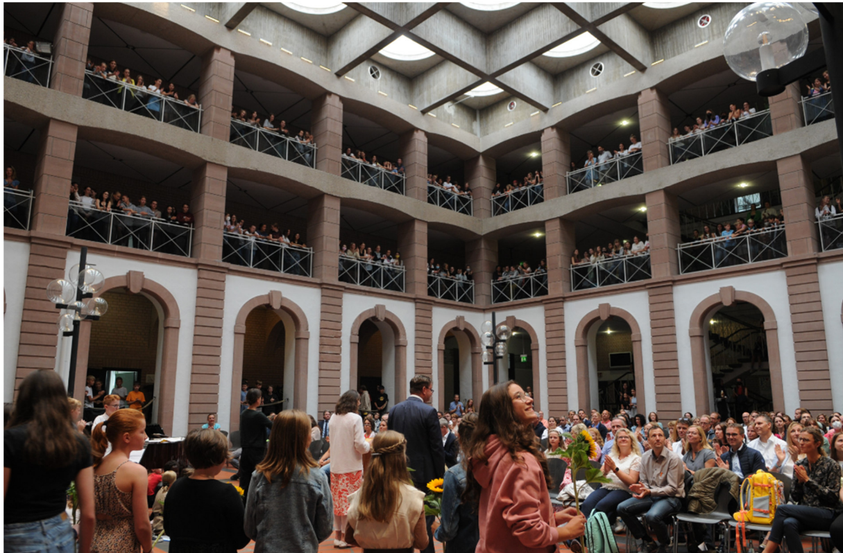
Einschulung der 5. Klassen

zu Beginn des neuen Schuljahres es ist mir wichtig, Sie auf diesem Wege über den Schulstart zu informieren und Ihnen wieder einige Neuigkeiten aus unserem Haus mitzuteilen.